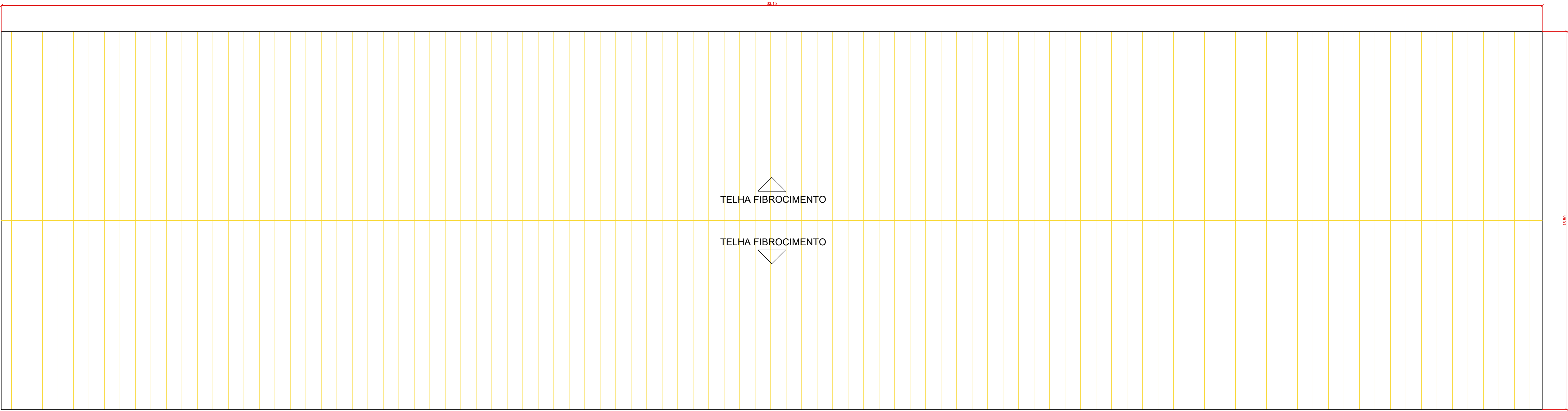
PLANTA DE COBERTURA AVIÁRIO 01 – DEMOLIR ESCALA.: 1/75

EXISTENTE DEMOLIR COBERTURA EM FIBROCIMENTO